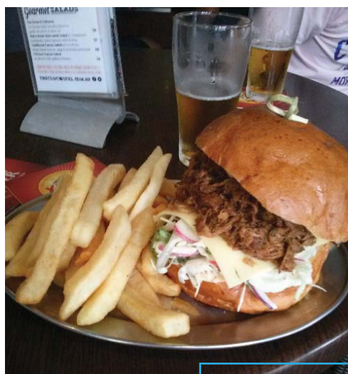
a BIG hamburger ~