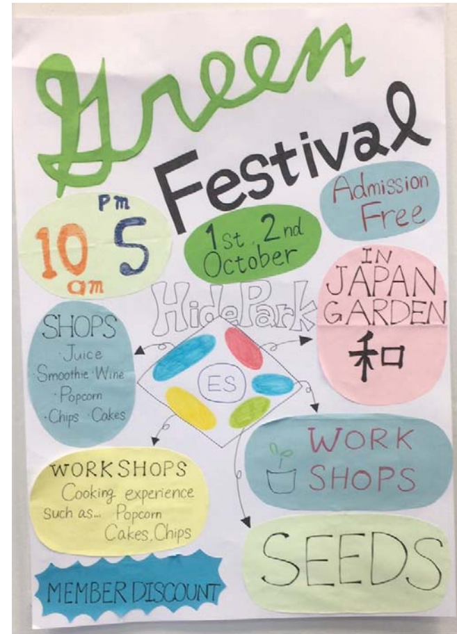
ポスター発表の例