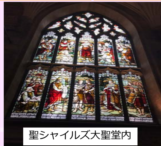
聖シャイルズ大聖堂内