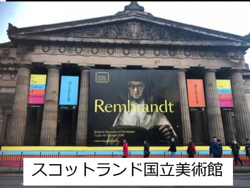
スコットランド国立美術館