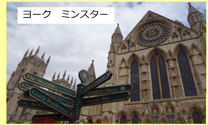
ヨーク ミンスター

街中心地に歴史ある城、大聖堂、美術館等が集まっており、どの観光客も魅了してしまう素晴らしい場所でした。 また、クラシックコンサートに行き、音楽に合わせて打ち上がる花火は、言葉にできないほど美しく、一生の思い出となりました。